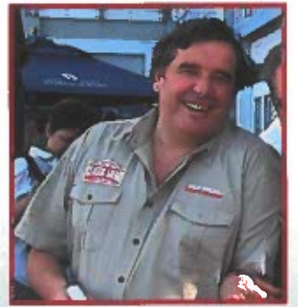
PHILIP YOUNG L'eroe del due mondi