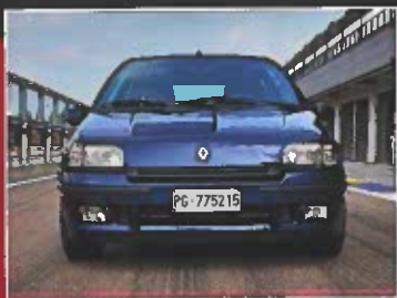
RENAULT CLIO WILLIAMS