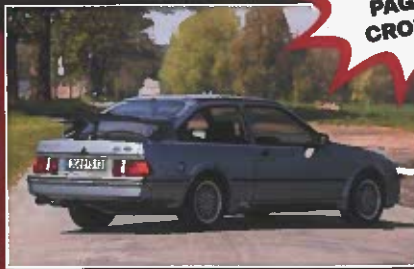
FORD SIERRA COSWORTH